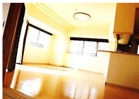
■ リビング ■