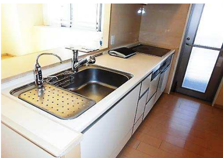
■ キッチン ■