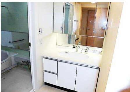
■ 洗面台 ■