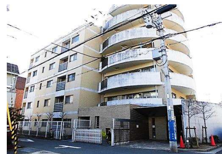
■ 外観写真 (東面) ■