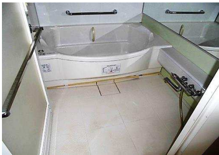
■ バスルーム ■