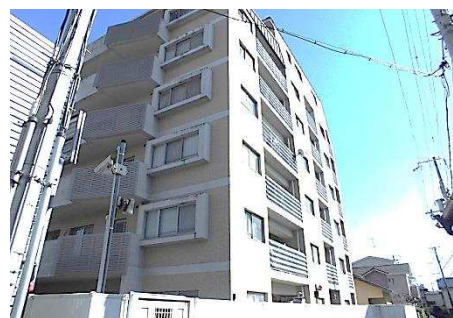
■ 外観写真 (西面) ■