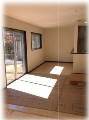
南向きの明るいリビング♪