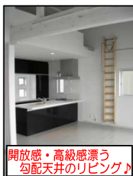
開放感・高級感漂う 勾配天井のリビング♪