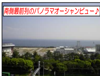
南側最前列のパノラマオーシャンビュー♪